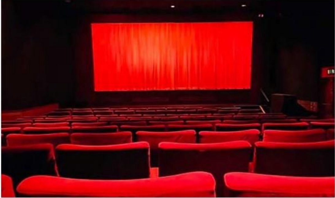
مهرجان سيدي قاسم