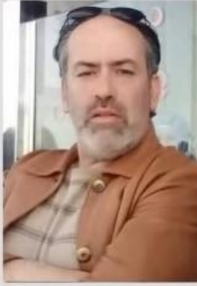
الضمان التشكيلي والفوتغرافيا د عزيز باعقا