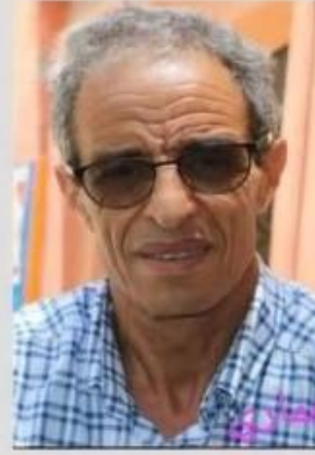
عضو مجلس د جلال الي يهيا